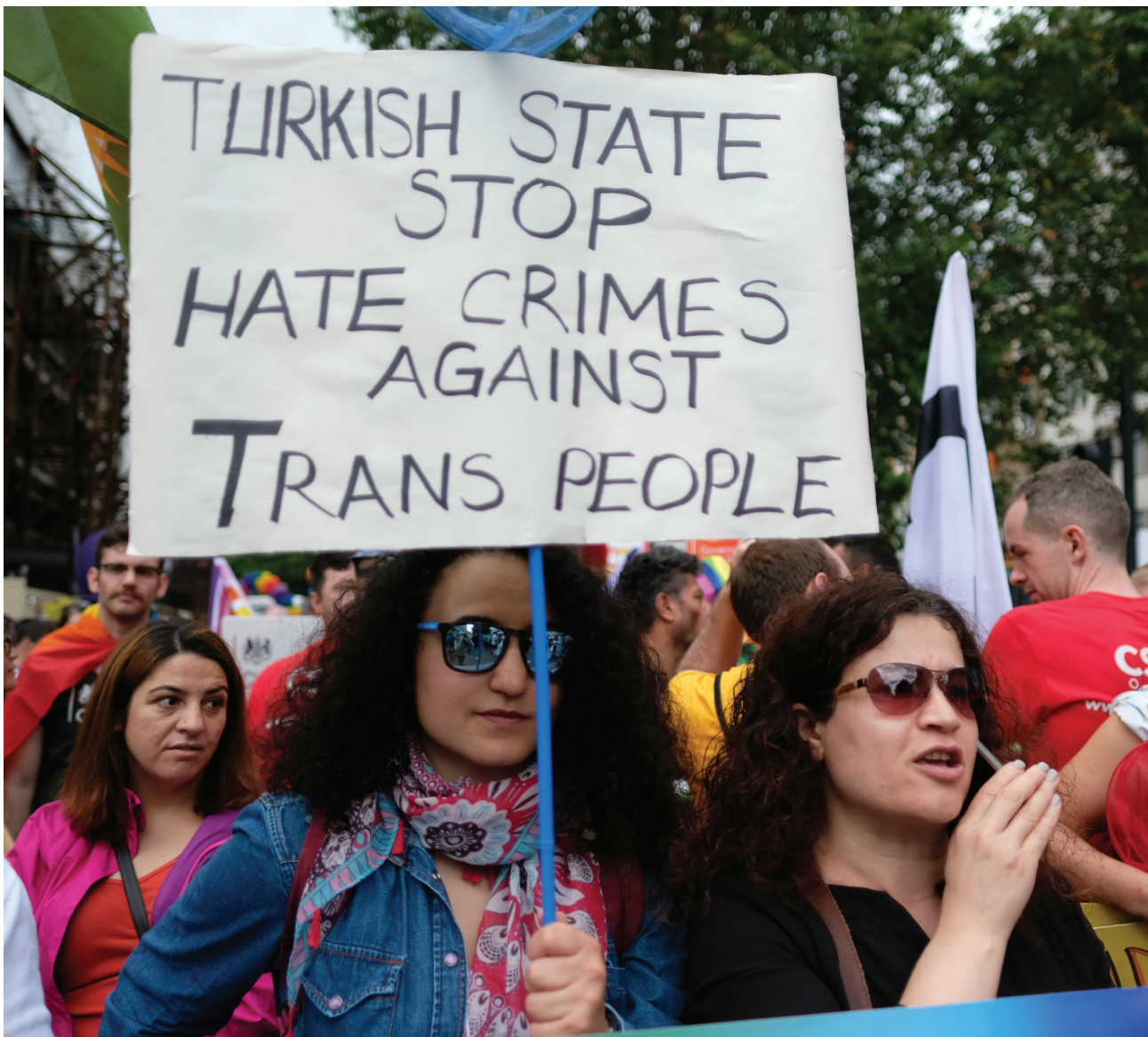
Солидарность с ЛГБТ сообществом Турции на Лондонском Прайд Параде - 25 июня 2016 года.