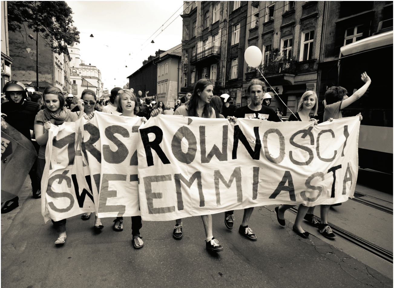
Марш Равенства, 2011 год, Польша.

Комплексная безопасность — это подход, направленный на интеграцию всех элементов безопасности для организации или конкретного лица, который подчёркивает взаимосвязь между цифровой безопасностью, психо-социальным благополучием и телесной неприкосновенностью 49 .