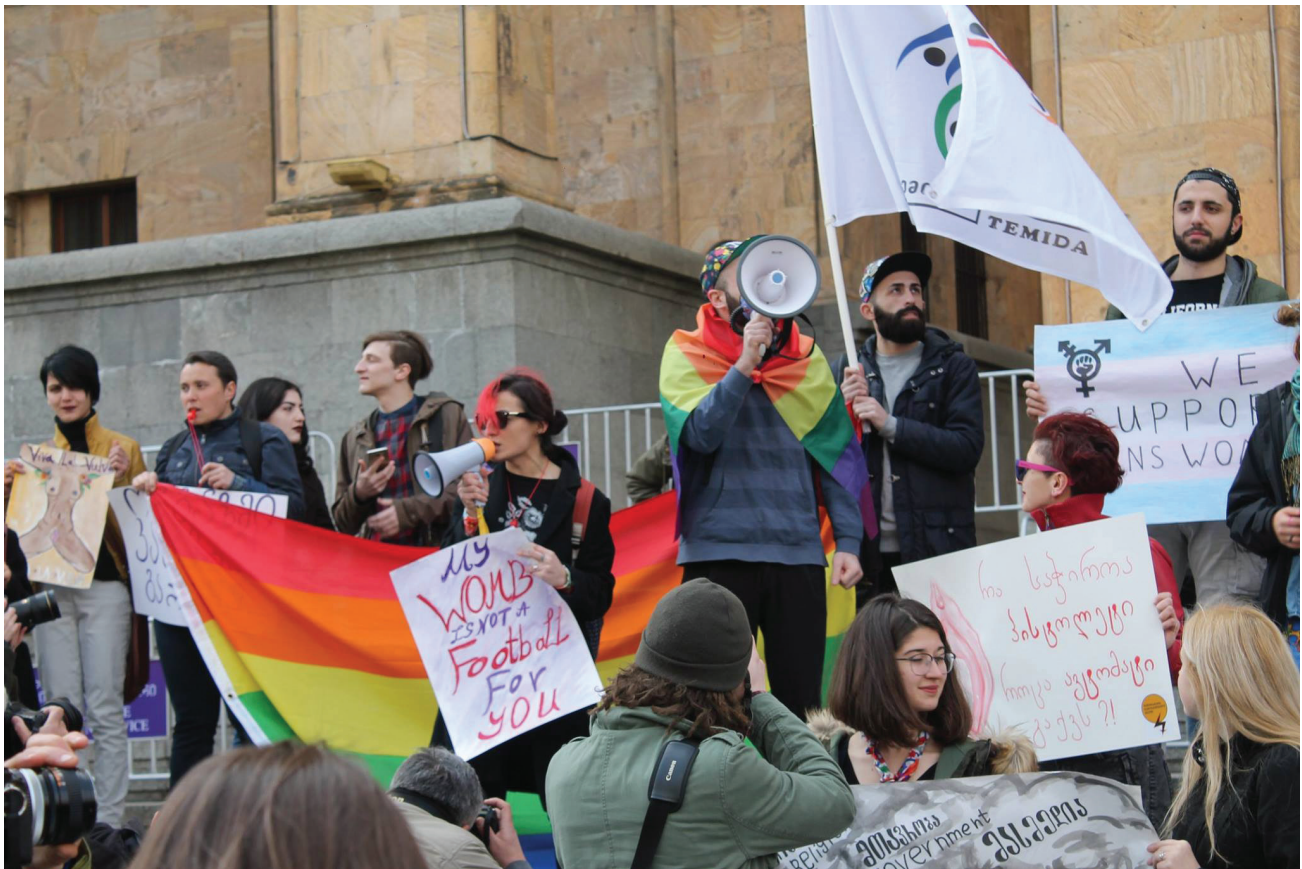
ЛГБТКИ-ассоциация «Темида», Тбилиси, Грузия, 2017 год.

зарегистрировал в рассматриваемом регионе 141 случай преступлений на почве ненависти, при этом в регионе имеются лишь девять неправительственных организаций (НПО), которые предоставляют информацию и базовые услуги для транс-людей, пострадавших от таких преступлений 5 . В некоторых странах Центральной Азии, таких как Узбекистан и Туркменистан, однополый секс между мужчинами остаётся уголовным преступлением, при этом правоохранительные органы регулярно используют это законодательство и подвергают издевательствам ЛГБТКИ-людей 6 .