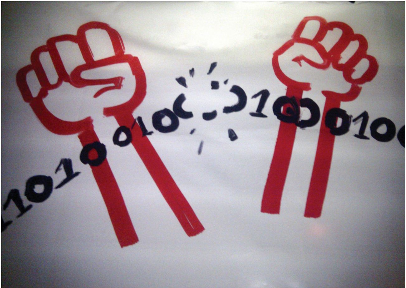
Сцены из Марша Равенства (a(n) Equality March), Польша, 2011 год.

существенным уровнем цензуры интернета и контроля за пользователь_ницами. Наличие информации на тему ЛГБТКИ является одним из основных критериев для отнесения веб-сайтов к списку запрещённых ресурсов в обеих странах 30 , что затрудняет для транс-активист_ок доступ к информации о трансгендерности.