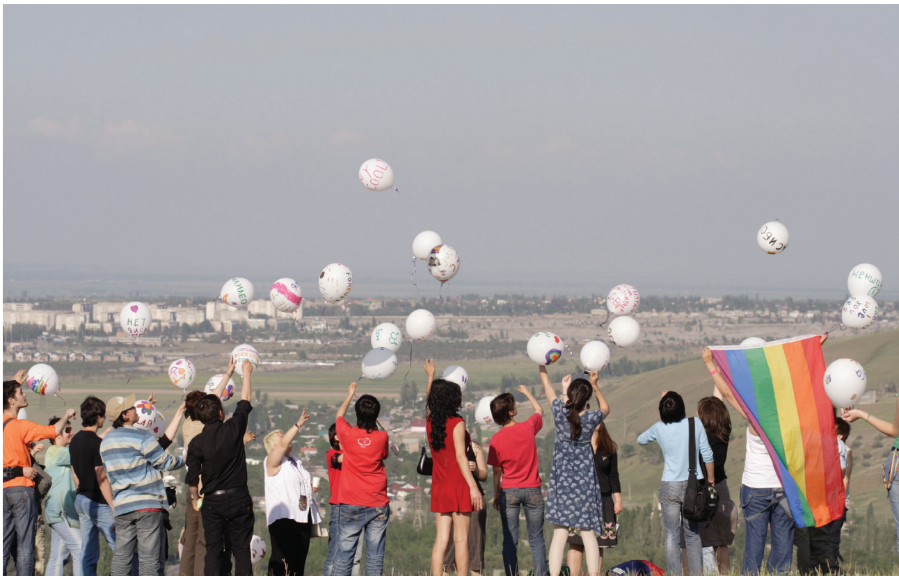
Мероприятие посвященное Международному Дню Против Гомофобии, 17 мая, 2008 год, Кыргызстан.