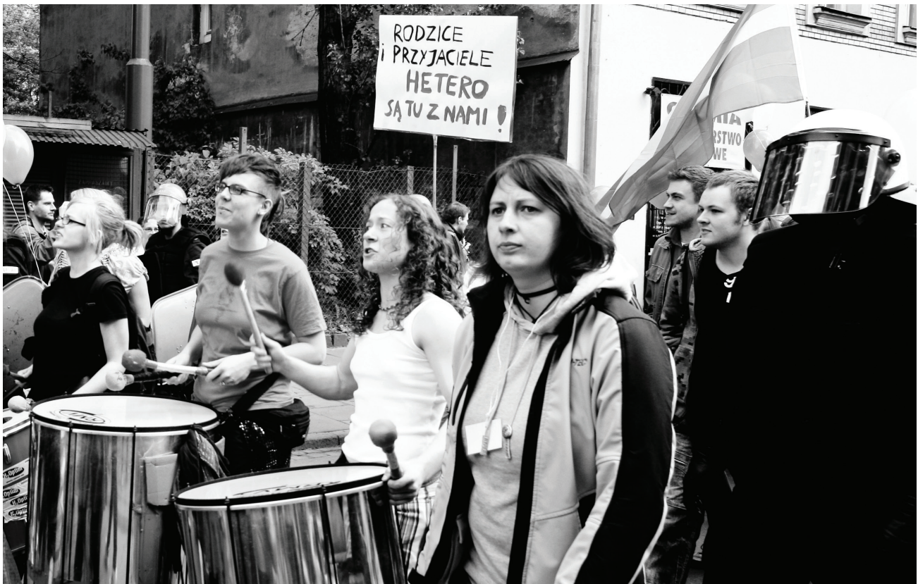
Сцены из Марша Равенства (a(n) Equality March), Польша, 2011 год.