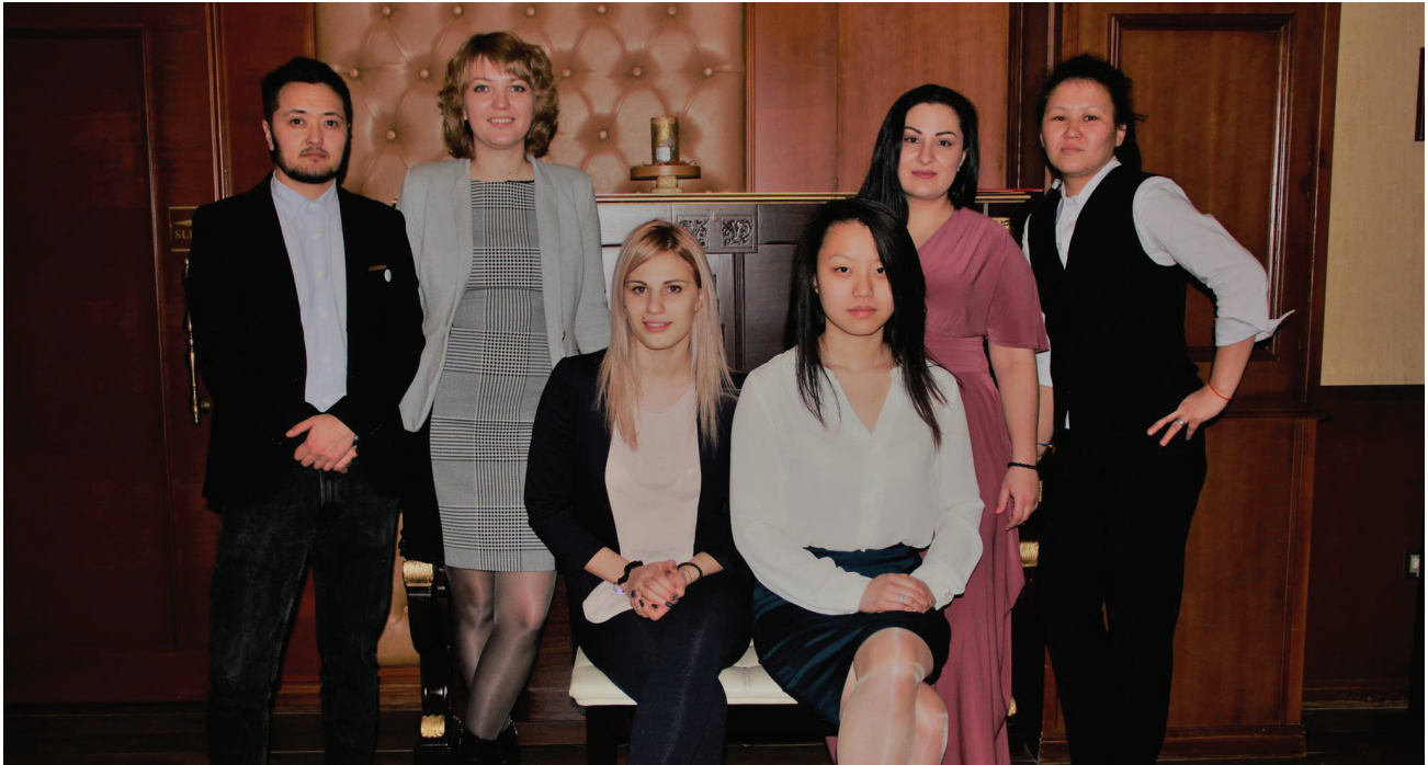
ЛГБТ организация «Лабрис», Кыргызстан на праздновании 13-го дня рождения организации, 2017 год.