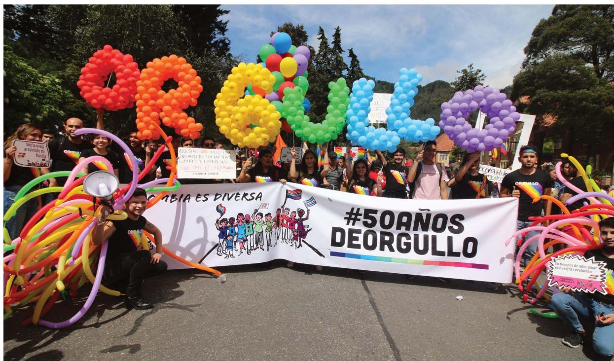
Marcha de orgullo de Bogotá. Colombia Diversa, 2019.

Como sostienen muchos activistas y activistas, la producción artística y cultural puede crear nuevas narrativas, representaciones, y posibilidades para contrarrestar los estereotipos negativos. Con este fin, GLEFAS ha organizado un Festival de Cine Global en Bogotá por los últimos ocho años para proyectar películas que ofrecen puntos de vista críticos sobre temas sociales, muestren a personas LGBTI, indígenas y afrodescendientes tal y como son, y fomente el diálogo público. La membresía de la red comunitaria trans también reta los estereotipos negativos poniendo narrativas alternativas en los medios de comunicación. Por ejemplo, varias integrantes fueron incluidas en el documental de una fuente importante de noticias llamado “Familia”. Si bien las fuentes de noticias dominantes suelen representar a las personas trans de manera espectacular y escandalosa, este documental muestra las realidades que debe negociar una familia trans amorosa dentro un contexto social heteronormativo. 47