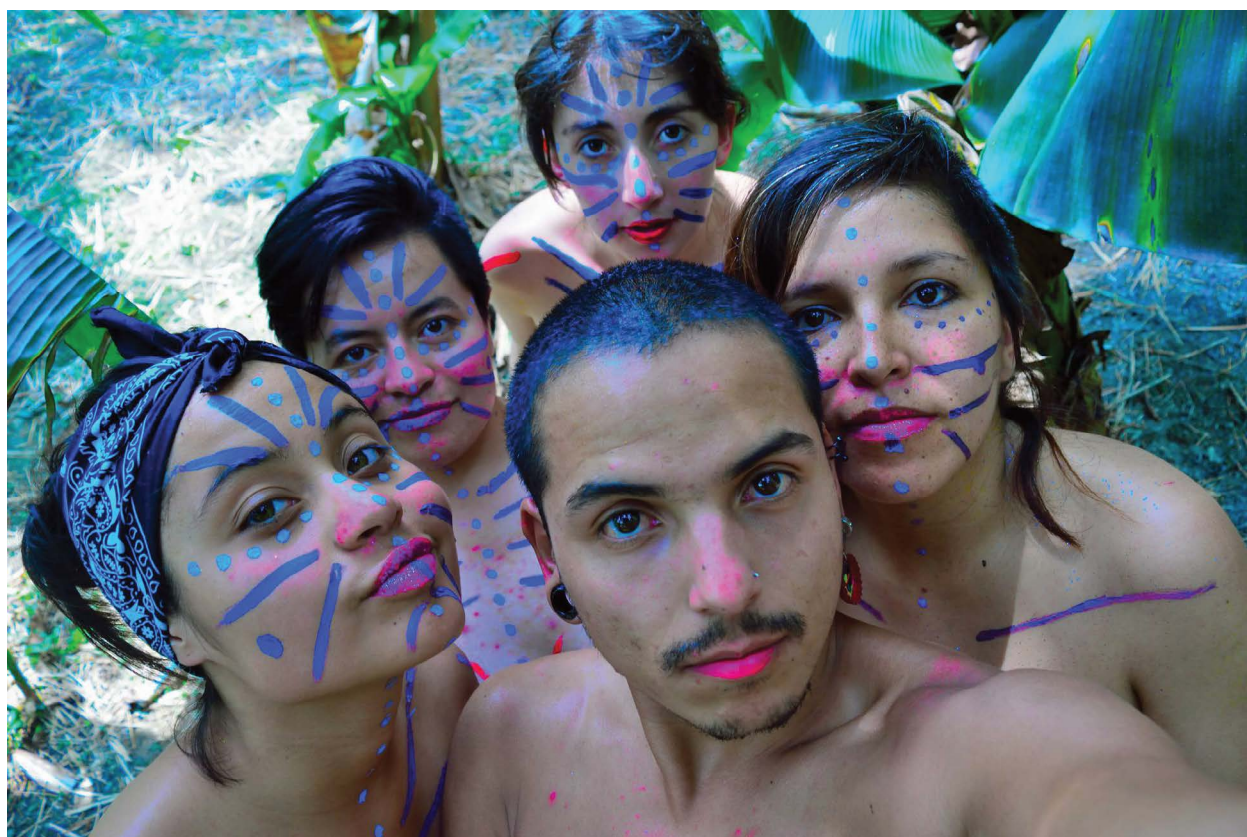
Mujeres al Borde, 2018.

local -en específico las reuniones del programa de desarrollo con enfoque territorial y los consejos de paz de la alcaldía y gobernación- no hacen un esfuerzo suficiente para convocar a la población en lugares convenientes en fechas y horarios en los que muchos puedan participar. Como afirma un activista por la paz LGBTI, no están verdaderamente comprometidos con abordar las necesidades de la comunidad y la consecuencia es una paz hecha por y para las élites. La membresía de GLEFAS también está preocupada por el potencial de un resultado basado en la élite, ya que no transformará los sistemas de opresión ni desafiará el racismo estructural y la apropiación de cuerpos a través de la violencia sexual.