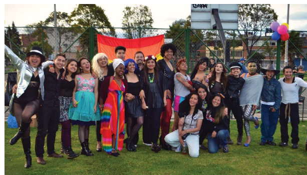
Marcha del Sur en Bogotá, Mujeres al Borde, 2017.

Las estrategias legales para la implementación incluyen reclamaciones de responsabilidad y protección y acciones de cumplimiento y ejecución. En términos de implementación otra estrategia importante es crear mecanismos de supervisión y grupos de control que participen en la promoción tecnocrática. Integrantes de Santamaría Fundación relatan sus experiencias en asistir al establecimiento de una mesa municipal de seguridad y recursos humanos en Cali. “Esta mesa es el resultado de una incidencia política y jurídica con el objetivo de facilitar el trabajo colaborativo entre las distintas agencias estatales responsables por la seguridad y justicia, el gobierno local y la oficina de la fiscalía pública para identificar, atender, y prevenir las violaciones de Derechos Humanos en contra del sector LGBTI.” En adición, otra estrategia legal incluye la litigación en la Corte Constitucional utilizando los derechos económicos, sociales y culturales para defender a las personas trans de la terrible discriminación en las áreas de salud, educación y vivienda, especialmente por la falta de implementación de las políticas públicas LGBTI.