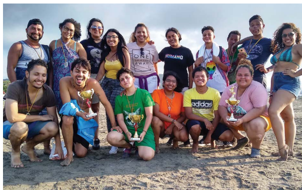
Festival deportivo en Soledad, Caribe Afirmativo, 2019.

La segunda fase, 2007-2016, se caracteriza por los logros legales para las parejas LGBTI y también el reconocimiento de los daños contra las personas LGBTI en el contexto del conflicto armado. En términos del contexto del conflicto armado, la Ley 1448 de Víctimas y Restitución de Tierras de 2011 fue la primera incluir reconocimiento y protección de personas LGBTI y un análisis del impacto diferencial de género del conflicto armado. 26 Así mismo, el caso Botalón en 2014 fue el primero en reconocer a la comunidad LGBTI como víctima de violaciones de Derechos Humanos perpetradas por las fuerzas paramilitares. 27