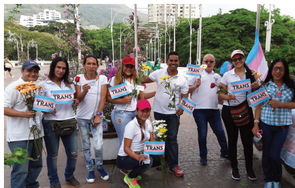
Santamaría Fundación, 2018.

Además, para ubicar las entrevistas y los materiales en un contexto nacional más amplio, la AI asistió al encuentro nacional de líderes políticos LGBTI el 16 de mayo de 2019 en Bogotá. Esta jornada de encuentro nacional tuvo lugar dentro de la programación de la conferencia más grande de Liderazgo Político LGBTI en América Latina y el Caribe, el Encuentro de Liderazgos Políticos de América Latina y el Caribe. Activistas y defensores LGBTI de 12 departamentos diferentes de Colombia participaron y presentaron sus temas y prioridades de la agenda política.