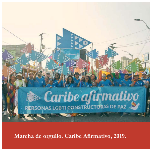
Marcha de orgullo. Caribe Afirmativo, 2019.

Existe un potencial increíble para documentar el impacto del conflicto armado interno en las personas LGBTI, que incluye un eje transversal de análisis de género en la Comisión de la Verdad, la Jurisdicción Especial para la Paz (JEP) y la Unidad de Personas Desaparecidas. Varies integrantes del personal de estas entidades estatales tienen una trayectoria de activismo y defensa de los derechos de las mujeres y LGBTI.