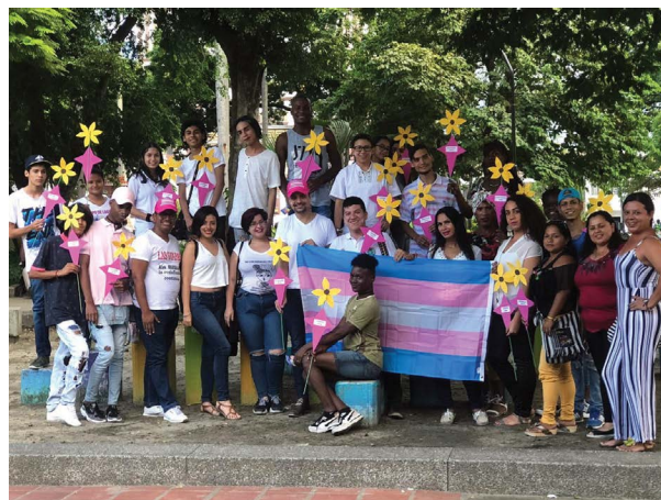
Santamaría Fundación, 2019.

La violación de derechos humanos más común a lo largo de las décadas ha sido el desplazamiento, con 7.358.248 víctimas según el Registro Nacional de Víctimas. El 17 por ciento de la población de Colombia ha sido desplazada. 10 Según el Banco Mundial, Colombia tenía una población de 49,648,685 en 2018. 11 Las personas LGBTI están sobrerrepresentadas en esta población desplazada debido a la violencia y la amenaza de violencia basada en prejuicios. La supervivencia y el bienestar de esta población LGBTI desplazada es una prioridad importante para el movimiento LGBTI. El actual proceso de paz es el primero en el mundo en incluir y abordar el impacto del conflicto armado interno en la población LGBTI. Por tanto, el actual proceso de paz ha abierto el potencial para una mayor inclusión política a través de la construcción de un nuevo pacto social. 12